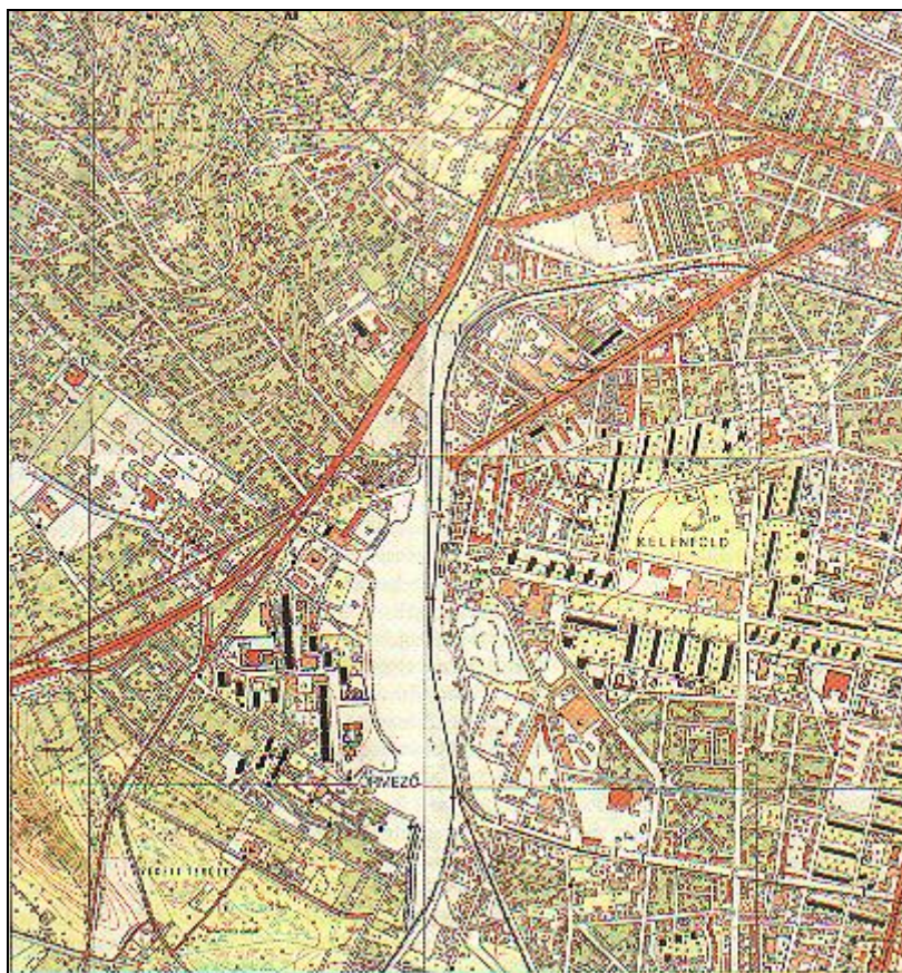
3. ábra. A tárgyalt térség jelenlegi helyszínrajza